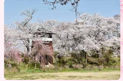
3月下旬～4月上旬・P有り