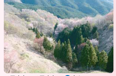
4月上旬～4月中旬・P有り