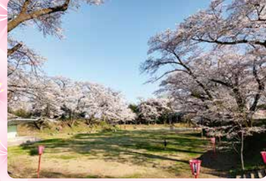
3月下旬～4月上旬・P有り