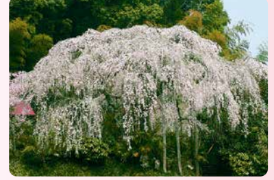
3月下旬～4月上旬・P有り