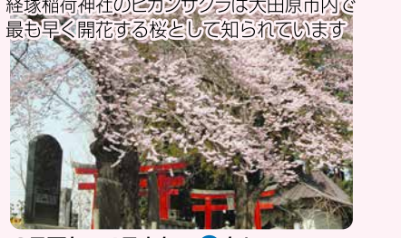
3月下旬～4月上旬・P有り