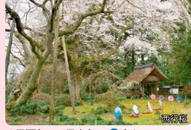
3月下旬～4月上旬・P有り