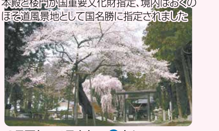
3月下旬～4月上旬・P有り (道の駅駐車可)