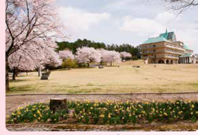
3月下旬～4月上旬・P有り